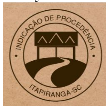
Figura 01: Selo 1

Elaborado por: Patricia Flach - Vanessa Hofstetter - Susane Priscila Deters