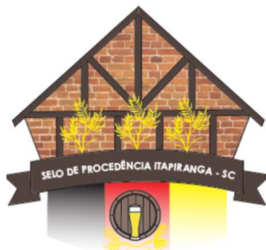
Figura 04: Selo 4

Elaborado por: Maiara Magri - Sara Jhuliana Reis