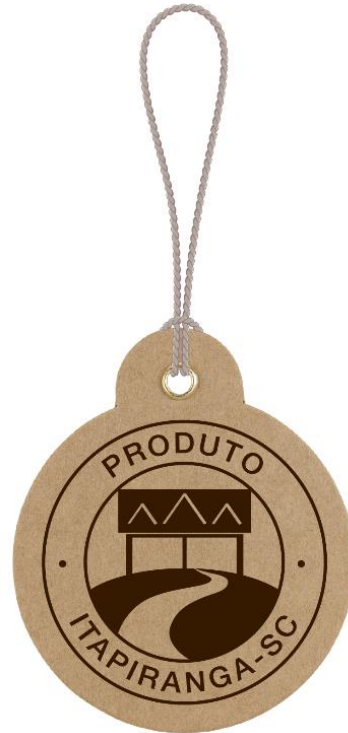
Figura 7: Selo Produto Itapiranga - aplicação