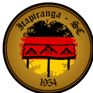
Figura 02: Selo 2

Elaborado por: Kivia Regina Unser - Sandra Fernandes Dos Santos