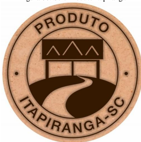
Figura 06: Selo Produto Itapiranga

A votação contou com 663 participantes no total, durante todos os dias e espaços em que esteve disponível para votação, destes, o selo que mais teve votos foi o de número 1, conforme figura 6, apresentada abaixo, de autoria das acadêmicas Patricia Flach, Vanessa Hofstetter e Susane Priscila Deters, contabilizando 208 votos.