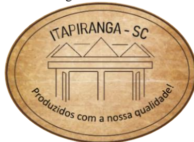
Figura 05: Selo 5

Elaborado por: Débora Heinen - Thais Brizola Kovalski