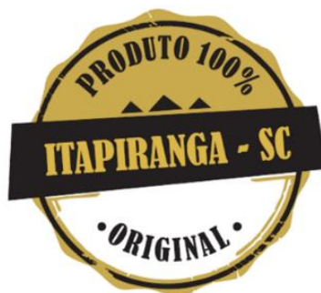
Figura 03: Selo 3

Elaborado por: Camila Antonia Gabiatti -Liara Stein